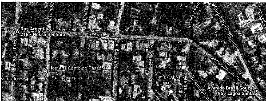
Figura 1-Imagem satélite da via que será pavimentada.

OBJETO: CONTRATAÇÃO DE EMPRESA PARA A REALIZAÇÃO DA OBRA DE RECAPEAMENTO DA RUA ARGENTINA (ENTRE RUA OURO PRETO E AV. ABGAIL P. COELHO) COM FORNECIMENTO DE MATERIAIS, EQUIPAMENTOS NECESSÁRIOS E MÃO DE OBRA.