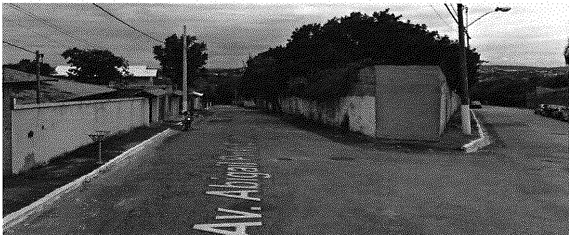
Figura 3- Vista Frontal da rua Argentina com Av. Abigail Pinto Coelho.